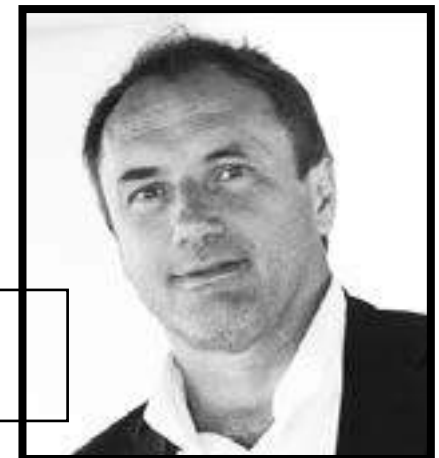
Ludovic Le Moan Cofondateur de Sigfox