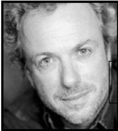
Frédéric Lenoir Philosophe, sociologue et écrivain