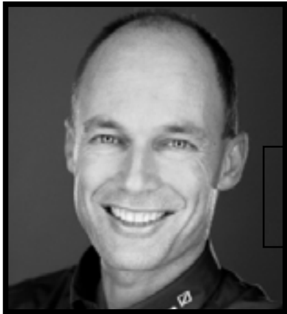
Bertrand Piccard Aéronaute, psychiatre et président de Solar Impulse