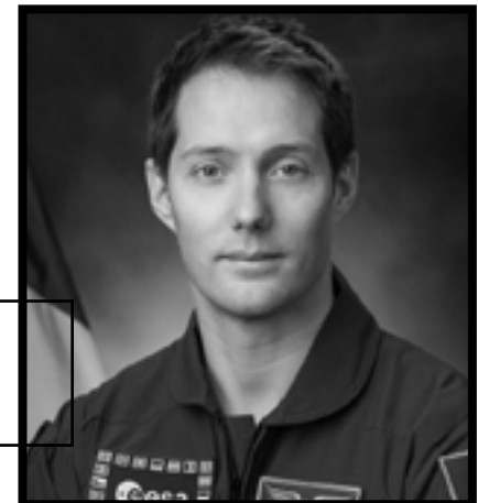
Thomas Pesquet Astronaute