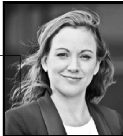
Axelle Lemaire Ancienne ministre du numérique