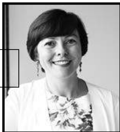
Carole Delga Présidente de la Région Occitanie