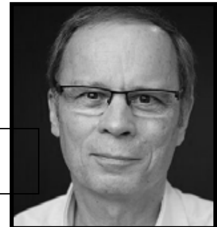
Jean Tirole Economiste et chercheur Prix Nobel d'Economie en 2014