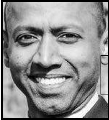
Ravi Nadjou Théoricien de l'économie frugale